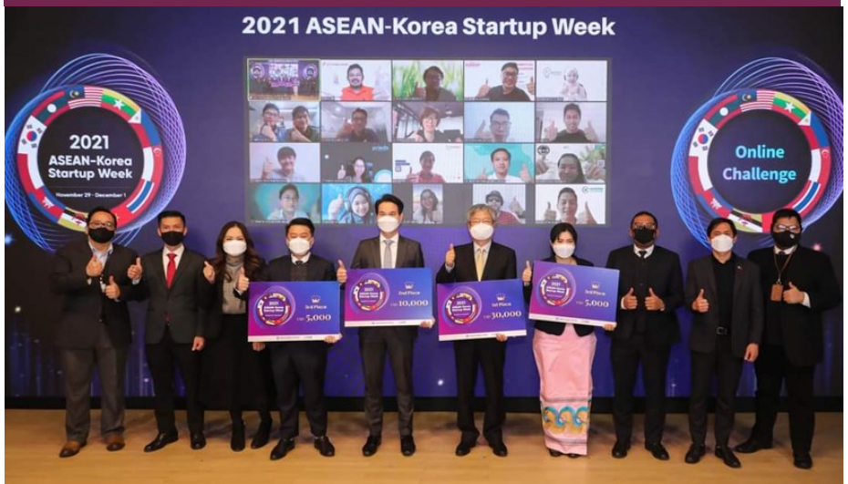
ပုံ။ (၁-၁၂-၂၀၂၁) ရက်နေ့ 2021 ASEAN-Korea Startup Week အစီအစဉ်၏ ဆုချီးမြှင့်ပွဲအခမ်းအနား

2021 ASEAN-Korea Startup Week အစီအစဉ်ကို ကိုရီးယားသမ္မတနိုင်ငံ၊ ဆိုးလ်မြို့၌ အခြေပြု၍ ၂၀၂၁ ခုနှစ်၊ နိုဝင်ဘာလ (၂၉) ရက်နေ့မှ ဒီဇင်ဘာလ (၁) ရက်နေ့အထိ (Online + Offline) Hybrid Format စနစ်ဖြင့်ကျင်းပခဲ့ပါသည်။ အဆိုပါအစီအစဉ်ကို ASEAN-Korea Centre (AKC) နှင့် Gyeonggi Center for Creative Economy & Innovation (GCCEI) တို့မှ ပူးတွဲကြီးမှူး၍ ASEAN Secretariat (ASEC)၊ ASEAN Coordinating Committee on Micro, Small & Medium Enterprises (ACC MSME)၊ Gyeonggi Center for Creative Economy & Innovation (GCCEI)၊ Ministry of SMEs & Startups of