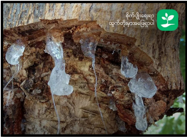
စိုက်ပျိုးရေးရာ ထွက်တိုးမှာအဖြေရှာပါ

မြန်မာနိုင်ငံမှ လျှော်ဖြူစေးများကို အဓိကဝယ်ယူနေသည့် တရုတ်နိုင်ငံက မဝယ်တော့သဖြင့် ပြည်တွင်းလျှော်ဖြူ အရောင်း အဝယ်ရပ်တန့်ကာ စိုက်ပျိုးသူများထံတွင် ပမာဏအများအပြား ဖြစ်နေကြောင်းသိရသည်။ “အဝယ်မရှိဘူး။ ပြည်တွင်းမှာက ဖြည့်စွက်စာအနေနဲ့ပဲစားကြတာ။ အခုကျတော့ အဲ့ဒါမျိုးကို မစားကြတော့ဘူး။ ပြည်ပကလည်း ကိုဗစ်ကြောင့် အရောင်း အဝယ်မဖြစ်ဘူး။ ပစ္စည်းတွေလည်းပုံနေတယ်။ ဈေးနှုန်းကျလား၊ တက်လား ပြောရမှာထက် ပစ္စည်းကို မဝယ်တော့တဲ့အတွက် အလကားပေးရင်တောင် အခုက ထားစရာမရှိတော့တဲ့အတွက် ယူကြမှာ မဟုတ်တော့ဘူး”ဟု မန္တလေးတိုင်းဒေသကြီးရှိ လျှော်ဖြူ