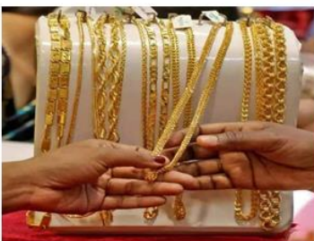
Popular News Journal

လတ်တလောတွင် ကမ္ဘာ့ရွှေဈေးနှုန်းမှာ တစ်အောင်စလျှင် အမေရိကန်ဒေါ်လာ ၂၀၀၀ ကျော်အထိ စံချိန်တင်မြင့်တက်လာပြီး အသင်း၏ရည်ညွှန်းဈေးနှုန်းမှာလည်း ၂၄ သိန်း နီးပါးအထိ ဈေးတင်သတ်မှတ်လာသည်ကို တွေ့ရသည်။