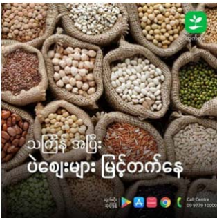
သင်္ကြန် အပြီး ပဲဈေးများ မြင့်တက်နေ

သင်္ကြန်အပြီး ပြည်ပ လိုအပ်ချက်ရှိနေသည့်အတွက် ပဲဈေးများ မြင့်တက်နေကြောင်း ဈေးကွက်မှ သိရပါသည်။