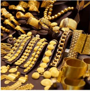
Popular News Journal

သင်္ကြန်ကာလအပြီး ပြန်လည်ဖွင့်လှစ်ခဲ့သည့် ရန်ကုန်ရွှေဈေးကွက်အတွင်းရှိ ဈေးနှုန်းများမှာ အမြင့်ပိုင်းတွင်သာ ဆက်လက်ရပ်တည်နေဆဲဖြစ်ကြောင်း ရန်ကုန်တိုင်းရွှေလုပ်ငန်းရှင်များအသင်းမှ ဖော်ပြထားသည့် ဈေးနှုန်းများအရ သိရသည်။