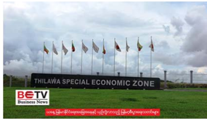
သတင်း - BETV Business

မြန်မာနိုင်ငံရှိ ဂျပန်ရင်းနှီးမြှုပ်နှံမှု လုပ်ငန်း ၇၀ ရာခိုင်နှုန်းခန့်က ကိုဗစ်-၁၉ ကပ်ရောဂါဂယက်နဲ့ အာဏာလွှဲပြောင်းမှု ဖြစ်စဉ်ကြောင့် ၎င်းတို့ရဲ့စီးပွားရေးကို ပြင်းထန်စွာ ရိုက်ခတ်မှုရှိခဲ့ပေမယ့် နိုင်ငံ အတွင်း (၁)နှစ် ဒါမဟုတ် (၂)နှစ် ဆက်လက်လုပ်ကိုင်ခြင်း၊ လုပ်ငန်းတိုးချဲ့ ခြင်းတွေ ပြုလုပ်သွားမယ်လို့ ဂျပန်ပြည်ပကုန်သွယ်ရေးအဖွဲ့(JETRO)ရဲ့ အစီရင်ခံစာမှာ ဖော်ပြထားပါတယ်။