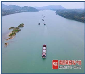
ရှင်းကျန်း ကုန်သွယ်ရေးကွန်ဗင်ရှင်းကုမ္ပဏီ၏ ကွေ့ဂမ်နှင့် ဝူကျိုးကြား ဩဇာလမ်းပိုင်းကို တွေ့မြင်ရပုံ

၂၀၂၁ ခုနှစ်၊ ဒီဇင်ဘာလ (၂၈)ရက်နေ့တွင် ရှင်းကျန်း ကုန်သွယ်ရေးကွန်ဗင်ရှင်းကုမ္ပဏီ၏ ကွေ့ဂမ်နှင့် ဝူကျိုးကြား ရေကြောင်းလမ်းပိုင်းပေါ်တွင် မက်ထရစ်တန်ချိန် (၃)ထောင်တင်ဆောင်ထားသည့်သင်္ဘောများပြေးဆွဲမည့် ပထမအဆင့်ကို စမ်းသပ်ခဲ့ကာ၊ ကွမ်ရှီး၏ ကုန်းတွင်းပိုင်းမြစ်များအားလုံးအနက် ကုန်စည် အလေးလံဆုံးတင်ဆောင်ထားသည့် သင်္ဘောပြေးဆွဲသည့် လမ်းကြောင်းဖြစ်လာမည်ဖြစ်ကြောင်း သိရပါသည်။