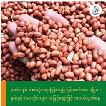
မတ်ပဲ နှင့် ပဲစင်းငုံ ဈေးပြန်လည် မြင့်တက်ကာ မြေပဲ ၊ နှမ်းနှင့် ပဲမာလိုင်းများ အမြင့်ဈေးဖြင့် အဝယ်သွက်နေ