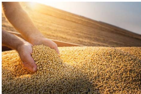
Soy. Photo: Map

ယခုမတ်လအတွင်း ပဲပုတ်စေ့တန်ချိန် ၁၃.၇၆၉ တန်တင်ပို့နိုင်ရန် ယခင်က ခန့်မှန်းခဲ့သော်လည်း လတ်တလောဖြစ်ပေါ်နေသည့် ကမ္ဘာ့အခြေ အနေများကြောင့် တင်ပို့နိုင်မည့် ပဲပုတ်စေ့ပမာဏအား တန်ချိန် ၁၂.၉ သန်းအထိ လျော့ချခဲ့ကြောင်း ဘရာဇီးလ်နိုင်ငံ နှံစားသီးနှံတင်ပို့သူများအသင်း (National Association of Cereal Exporters - Anec)က ပြောကြားခဲ့သည်။