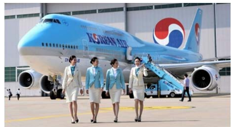
လေယာဉ်ဆီ ဈေးတက်သဖြင့် ဇူလိုင်လတွင် Korean Air လေယာဉ်လက်မှတ် ဈေးတက်မည်ဟုဆို

Korean Air သည် လေယာဉ်ဆီဈေးနှုန်းများ မြင့်တက်နေချိန်တွင် နိုင်ငံတကာခရီးစဉ်များတွင် လောင်စာဆီဖိုး မြင့်တက်သည့်အလျောက် လေယာဉ်လက်မှတ်ခများတွင် အပိုထပ်ဆောင်းကောက်ခံရန် စီစဉ်ထားကြောင်း လေကြောင်းလုပ်ငန်းဆိုင်ရာ သတင်းရင်းမြစ်များက ကြာသပတေးနေ့ (ဇွန်လ ၁၆ ရက်)တွင် ပြောကြားသည်။