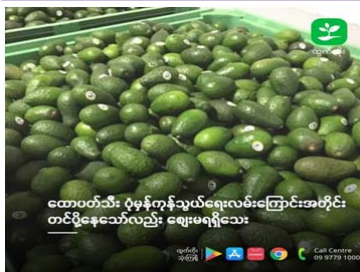
ထောပတ်သီး ပုံမှန်ကုန်သွယ်ရေးလမ်းကြောင်းအတိုင်း တင်ပို့နေသော်လည်း ဈေးမရရှိသေး

နှစ်လကျော်ကြာ ရပ်တန့်ခဲ့သည့် ထောပတ်သီး ပြည်ပတင်ပို့မှု ပြန်လည်တင်ပို့ နိုင်ပြီဖြစ်ကြောင်း မြန်မာနိုင်ငံ ထောပတ်သီး တင်ပို့ရောင်းချသူများအသင်းမှ သိရသည်။