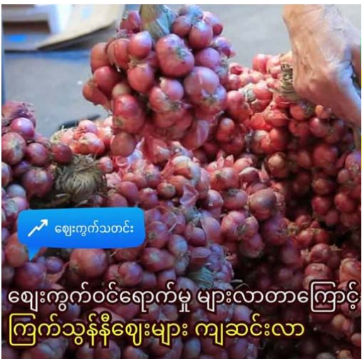
ဈေးကွက်သတင်း