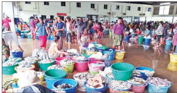
ထိုင်းနိုင်ငံဘက်သို့ မြန်မာနိုင်ငံမှငါးများ စုစည်းတင်ပို့ရာ မြိတ်မြို့၊ ငါးလေလဲချေးကြီး။

တနင်္သာရီတိုင်းဒေသကြီးမှ ရေထွက်ကုန်ပစ္စည်း ၁၀ မျိုးကို ထိုင်းနိုင်ငံဘက်သို့ တင်သွင်းခွင့်ယာယီပိတ်ထားမှုကို မြန်မာနိုင်ငံ ဆိုင်ရာ ထိုင်းသံအမတ်ကြီးနှင့် တနင်္သာရီတိုင်းဒေသကြီး ငါးလုပ်ငန်း အဖွဲ့ချုပ်တို့ဆွေးနွေးမှုအရ ထိုင်းနိုင်ငံဘက်က အကန့်အသတ်မရှိ ပြန်လည်ရွှေ့ဆိုင်းလိုက်ကြောင်း သိရသည်။