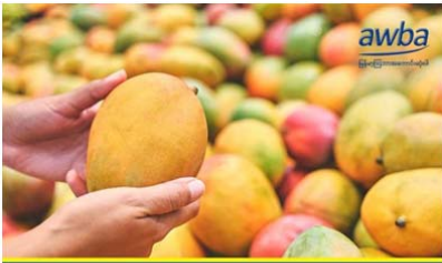
တရုတ်သို့သရက်သီးများတင်ပို့ရောင်းချရာတွင် သယ်ယူပို့ဆောင်စရိတ်များ ထက်ဝက်ခန့်စွမ်းတက်

မူဆယ် ၁၀၅ မိုင်မှ တရုတ်နိုင်ငံသို့ စိန်တစ်လုံးသရက်သီးများ တင်ပို့ရောင်းချရာတွင် သယ်ယူပို့ဆောင်စရိတ်များ ထက်ဝက်ခန့်မြင့်တက်လာသောကြောင့် တောင်သူများ တွတ်ခြေကိုက်ရန် ရုန်းကန်နေရကြောင်း စိန်တစ်လုံးသရက် တင်ပို့ရောင်းချသူများမှ စုံစမ်းသိရှိရသည်။