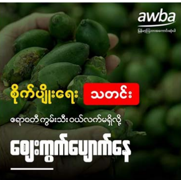
စိုက်ပျိုးရေး သတင်း ဧရာဝတီကွမ်းသီးဝယ်လက်မရှိလို့ ဈေးကွက်ပျောက်နေ

ဧရာဝတီတိုင်းဒေသကြီးကထွက်ရှိတဲ့ ကွမ်းသီးဈေးကွက် ဝယ်လိုအားမရှိတာကြောင့် ဈေးကွက်ပျောက်နေတယ်လို့ ကွမ်းသီးရောင်းဝယ်ရေး လုပ်ကိုင်သူတွေဆီကနေ သိရပါတယ်။