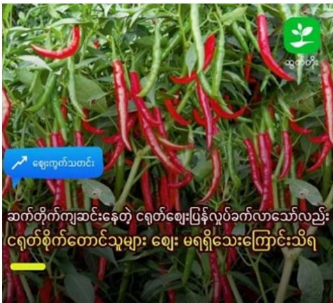
ဆက်တိုက်ကျဆင်းနေတဲ့ ငရုတ်ဈေးပြန်လှုပ်ခတ်လာသော်လည်း ငရုတ်စိုက်တောင်သူများ ဈေး မရရှိသေးကြောင်းသိရ

ဆက်တိုက်ကျဆင်းနေသည့် ငရုတ်ဈေး ပြန်လှုပ်ခတ်လာသည်ဆိုသော်လည်း တွက်ချေကိုက်သောဈေးမရရှိသေးကြောင်း ငရုတ်စိုက်တောင်သူများ ထံမှ သတင်းရရှိသည်။