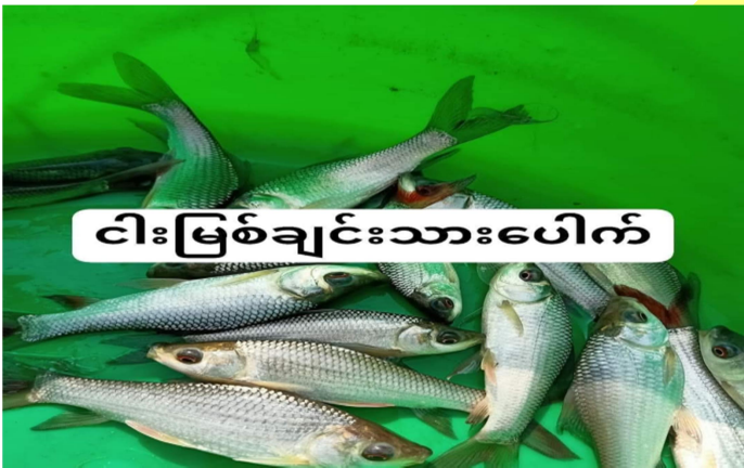
ငါးမြစ်ချင်းသားပေါက်

ဧရာဝတီတိုင်းဒေသကြီး၊ မအူပင်ခရိုင်သည်စပါးကို အဓိကစိုက်ပျိုးပြီး ရေထွက်ကုန်၊ လယ်ယာထွက်ကုန်များ လုပ်ငန်းများ လုပ်ကိုင်ဆောင်ရွက်နိုင်ရန် မြေခံ ၊ ရေခံ ကောင်းမွန်သော မြို့နယ်တစ်ခုဖြစ်သည်။