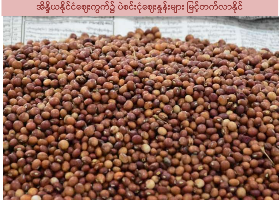
အိန္ဒိယနိုင်ငံဈေးကွက်၌ ပဲစင်းငုံဈေးနှုန်းများ မြင့်တက်လာနိုင်

အိန္ဒိယပြည်တွင်းဈေးကွက်တွင် မကြာသေးမီကာလ၌ ပဲစင်းငုံဈေးနှုန်းများ အတန်အသင့်လျော့ကျခဲ့သော်လည်း ပြည်ပမှတင်သွင်းနိုင်မှုလျော့နည်းနိုင်ခြင်း၊ လာမည့် ပွဲတော်ရာသီကာလ၌ ဝယ်လိုအား မြင့်တက်လာခြင်းတို့က ပဲစင်းငုံဈေးနှုန်းကို မြင့်တက်လာစေနိုင်ကြောင်း ကျွမ်းကျင်သူများက သုံးသပ်ထားကြောင်း သတင်းကို အိန္ဒိယသတင်း ဝက်ဘ်ဆိုက်များတွင် ဖော်ပြထားသည်။