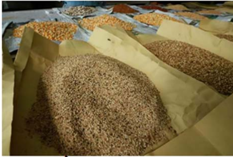
မကွေးဂျာနယ်

ယခုရက်ပိုင်းအတွင်း မန္တလေး ဈေးကွက်သို့ ပေါ်ဦးပေါ်ဖျား ဂျပန် နှမ်းဖြူများ အဖွင့်ဈေးကောင်းဖြင့် ဝင်ရောက်လာကာ အရောင်းအဝယ် များ သွက်လက်မြန်ဆန်နေကြောင်း မန္တလေးမြို့ရှိ နှမ်းကုန်သည်များထံမှ သိရသည်။