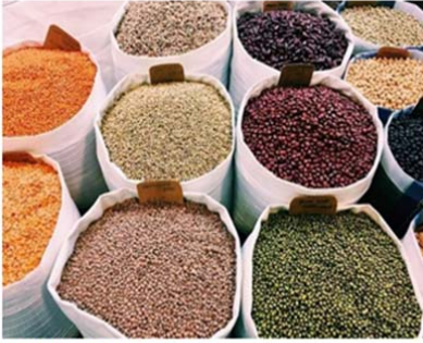
Popular News Journal

ပြီးခဲ့သည့် မေလ (၁) ရက်မှ (၃၁) ရက်အထိ တစ်လတာအတွင်း ပြည်ပနိုင်ငံများသို့ ပဲတီစိမ်း၊ မတ်ပဲနှင့်ပဲစင်းငုံတန်ချိန် စုစုပေါင်း ၁၄၈၂၀ ကျော် တင်ပို့ခဲ့ပြီး ပို့ကုန်ဝင်ငွေ အမေရိကန်ဒေါ်လာ သန်း (၁၁၀) ကျော်ရရှိခဲ့ကြောင်း စီးပွားရေးနှင့် ကူးသန်းရောင်းဝယ်ရေးဝန်ကြီးဌာနမှ ရရှိသည့်အချက်အလက်အရ သိရသည်။