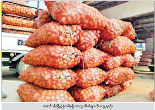
အောင်ပန်းမြို့ပွဲတစ်ခုရှိ အာလူးအိတ်များကို တွေ့ရစဉ်။

အာလူးအဝင်များလာသည့်အတွက် ဈေးကျနေပြီး လာမည့် လပိုင်းတွင်လည်း ယခုအတိုင်း ဆက်လက်ရှိနေနိုင်ကြောင်း အာလူး ဈေးကွက်အတွင်းမှသိရသည်။ ယင်းသို့ အာလူးဈေးနှုန်းများ ဆက်လက်ကျဆင်းနေခြင်းမှာ မြန်မာနိုင်ငံဈေးကွက်အတွင်းသို့ တရုတ်နိုင်ငံဘက်မှ မျက်နှိအာလူးများ ဝင်ရောက်လာခြင်းအပါအဝင် မြန်မာနိုင်ငံအတွင်း စိုက်ပျိုးထွက်ရှိသည့် အာလူးများ ဈေးကွက်အတွင်း ပေါများလာသောကြောင့်ဖြစ်ကြောင်းသိရသည်။ “စပေါ်တုန်းကဆို ဆိုဒ်ကြီးက တစ်ပိဿာ ငွေကျပ် ၂,၆၀၀ ကနေ ငွေကျပ် ၂,၈၀၀ အထိ ရောင်းတာ။ အခုအဲဒီဆိုဒ်က ငွေကျပ် ၂,၀၀၀ ပဲတန်တယ်။ ကျသွား တာပေါ့။ နှစ်ပတ်ကျော်လောက်တော့ရှိပြီ။ ဘာလို့ကျတာလဲဆိုတော့ မန္တလေးဘက်လည်း အာလူးတွေရပြီလေ။ မြစ်ကြီးနား ဘက်ကရပြီ။ နောက်ပြီး တရုတ်ပြည်ဘက်ကနေ ဈေးချိုတဲ့မျက်နှိအာလူးတွေ ဝင်လာပြီ။ နောက်လအထိ သွားမယ်ထင်တယ်” ဟု ဟိုပုံးမြို့နယ်ရှိ အာလူးရောင်းဝယ်ရေးဆိုင်တစ်ဆိုင်မှ ဆိုင်ရှင်တစ်ဦးကပြောသည်။