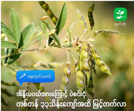
ထွက်တိုး ဈေးကွက်သတင်း အိန္ဒိယဝယ်အားကြောင့် ပဲစင်းငုံ တစ်တန် ၃၃သိန်းကျော်အထိ မြင့်တက်လာ

ပြည်တွင်းစားနပ်ရိက္ခာဖူလုံရေးအတွက် အိန္ဒိယနိုင်ငံမှ ဝယ်ယူတင်သွင်းနေခြင်းကြောင့် ပြည်တွင်းဈေးကွက်တွင် ပဲစင်းငုံနီက တစ်တန်ကို ကျပ် ၃၃ သိန်းကျော်အထိ ဈေးမြင့်တက်လာပါသည်။