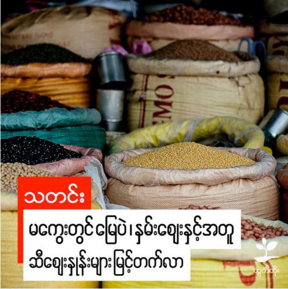
သတင်း မကွေးတွင်မြေပဲ၊နှမ်းဈေးနှင့်အတူ ဆီဈေးနှုန်းများမြင့်တက်လာ

ထံမှသိရသည်။ မြေပဲဆန်တစ်ပိဿာဈေးမှာ စက်တင်ဘာလကုန်က ကျပ် ၂၆၀၀ ကျော်သာရှိခဲ့ရာမှ ယခု အောက်တိုဘာလလယ်တွင် ကျပ် ၃၂၀၀ အထိ ဈေးမြင့်တက်လာပြီး နှမ်းအဖြူ တစ်တင်းမှာ ကျပ် ၄၆၅၀၀ ခန့်မှ ကျပ် ၄၉၀၀၀ သို့ မြင့်တက်လာကြောင်းသိရသည်။ ထို့ကြောင့် ဆီဈေးနှုန်းများမှာလည်း မြေပဲဆီမှာ ယခင်လက တစ်ပိဿာလျှင် ကျပ် ၆၅၀၀ မှ ယခုလတွင် ကျပ် ၇၅၀၀ သို့ မြင့်တက်လာပြီး နှမ်းဆီဈေးမှာ ယခင်လက တစ်ပိဿာလျှင် ကျပ် ၆၈၀၀ မှ ယခုလတွင် ကျပ် ၈၀၀၀ သို့ မြင့်တက်လာကြောင်း ဆီအရောင်းဆိုင်များထံမှသိရသည်။ ဆုံကြိတ်နှမ်းဆီ တစ်ပိဿာလျှင် ကျပ် ၈၅၀၀ဖြင့်