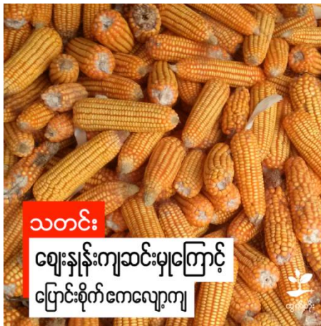
သတင်း ဈေးနှုန်းကျဆင်းမှုကြောင့် ပြောင်းစိုက်ဧကလျော့ကျ

ပြောင်းဈေးနှုန်းမှာ ယခင်နှစ်နှင့် နှိုင်းယှဉ်ပါက လျော့ကျနေသည့် အတွက် ယခု ပြောင်းစိုက်ရာသီတွင် စိုက်ဧက လျော့ကျသွားကြောင်း မြန်မာနိုင်ငံ ပြောင်းလုပ်ငန်း အသင်း ထံမှ သိရသည်။ ၂၀၁၇ ခုနှစ်နဲ့ ၂၀၁၈ ခုနှစ်မှာ ပြောင်းစိုက် ဧကတွေတိုးတယ်။ ဈေးကွက်မှာလည်း ဈေးနှုန်းတွေမြင့်ခဲ့တော့ တခြားသီးနှံ စိုက်တဲ့ နေရာမှာ ပြောင်းစိုက်လာကြ တယ်။ ဒါပေမယ့် လွန်ခဲ့တဲ့ ခြောက်လ ပိုင်းလောက်ကစပြီး ပြောင်းဈေးတွေ