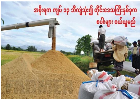
အစိုးရက ကျပ် ၁၃ ဘီလျှံသုံး၍ တိုင်းဒေသကြီးနှစ်ခုက စပါးများ ဝယ်ယူမည်

ရန်ကုန်တိုင်းဒေသကြီးပါ ပါမယ်ဆိုရင်တော့ ကျပ်နှစ်ဘီလျှံရရှိမှာပါ။ ဒါနဲ့ပတ်သက်လို့ ရန်ကုန်၊ ပဲခူးနဲ့ ဧရာဝတီတိုင်း