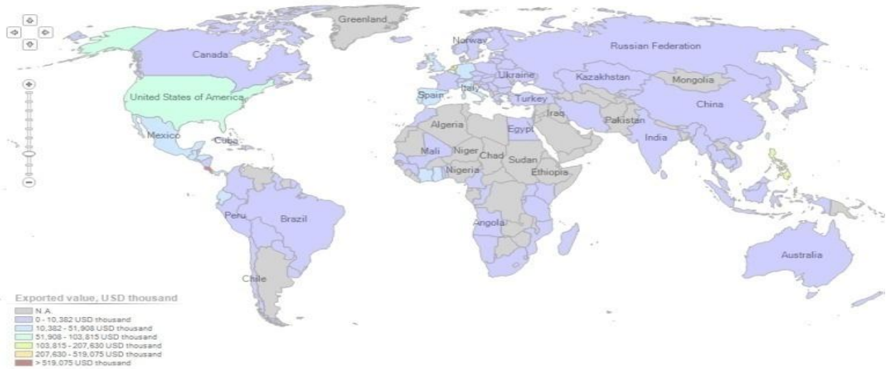
List of exporting countries for the selected product in 2018 Product : 080430 Fresh or dried pineapples