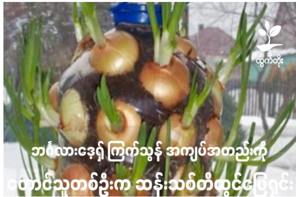
ဘင်္ဂလားဒေ့ရှ် ကြက်သွန် အကျပ်အတည်းကို တောင်သူတစ်ဦးက ဆန်းသစ်တီထွင်ဖြေရှင်းခဲ့

ဘင်္ဂလားဒေ့ရှ်နိုင်ငံ၌ ကြက်သွန်ဈေးများ တစ်ကီလိုလျှင် တာကာငွေ ၂၅၀ အထိ ခေါင်ခိုက်မြင့်တက်ခဲ့ချိန်တွင် တန်ကျူလီယာ ခရိုင်ခွဲမှ တောင်သူတစ်ဦးက ဆန်းသစ်တီထွင်သော စိတ်ကူးတစ်ခု ရရှိလာခဲ့သည်။ ထိုစိတ်ကူးမှာ ပလတ်စတစ်ဘူးခွံများအတွင်း ကြက်သွန်စိုက်ပျိုးပြီး တစ်နှစ်ပတ်လုံး ကြက်သွန်ထုတ်လုပ်နိုင်မည့် နည်းဖြစ်သည်။ “ပထမကတော့ ဘူးခွံတစ်လုံးထဲမှာအစမ်းအနေနဲ့ စိုက်ကြည့်ခဲ့တယ်။ အကုန်အကျသိပ်မများဘဲနဲ့ မကြာခင်မှာပဲ အထွက်ကောင်းကို ရရှိခဲ့ပါတယ်။ အဲဒီနောက်တော့ ကျွန်တော့်အိမ်မှာ နောက်ထပ်ဘူးခွံတွေနဲ့ ကြက်သွန်တစ်နှစ်ပတ်လုံး စိုက်ပျိုးဖို့ ဆုံးဖြတ်