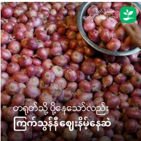
တရုတ်သို့ ပို့နေသော်လည်း ကြက်သွန်နီဈေးနိမ့်နေဆဲ

နှစ်စဉ်ကဲ့သို့ ပြည်တွင်း ကြက်သွန်နီဈေး မလအတွင်း မူဆယ် နယ်စပ်သို့ တင်ပို့မှုရှိသော်လည်း ဈေးနှုန်းအနိမ့်တွင်သာ ပြည်တွင်းဈေးကွက်တွင်ရှိနေဆဲ ဖြစ်သည်။ မြစ်ဝကျွန်းပေါ်ဒေသမှ ငရုတ်ရှည်အသစ်များ ငရုတ်ဈေးကွက်သို့ ဝင်ရောက်လာချိန် ဈေးနှုန်းထပ်မံကျဆင်းလာသည်။ အသုံးနည်းသော အုန်းဆီဈေးမှာ စံချိန်တင်မြင့်တက်လာရာ တစ်ပိဿာလက်ကားဈေး ကျပ် ၇၅၀၀ ဝန်းကျင် အထိ ဈေးမြင့်တက်လာသည်။ မူဆယ်နယ်စပ်သို့ အညာဈေးကွက်က မေ ၁ ရက်မှ ၂၅ ရက် အတွင်း ကြက်သွန်နီတန်ချိန် ၈၈၄၅ တန် တင်ပို့ခဲ့သော်လည်း ဈေးနှုန်း တစ်ပိဿာ ကျပ် ၅၇၀ဝန်းကျင်၊ တစ်တန် ကျပ် ၃၅၄၀၀၀ (ယွမ် ၂၈၇၀) သာ ရှိသည်ဟု ၎င်းနယ်စပ်ကုန်သွယ်ရေး ဈေးကွက်သတင်းဖော်ပြချက်များအရသိရသည်။ ကြက်သွန်နီထွက်ရှိရာ ပခုက္ကူ၊ မုံရွာ၊ မြင်းခြံဈေးကွက်များတွင် အမြင့်ဆုံးဈေးနှုန်း တစ်ပိဿာကျပ် ၄၇၀-၄၈၀ ဝန်းကျင်သာရှိပြီး ဇွန် ၃ ရက် ရန်ကုန်ဈေးကွက်တွင်လည်း ဆိပ်ဖြူလက်ကားတစ်ပိဿာ ၄၇၅ ကျပ်မှကျပ် ၅၀၀ ၊ မြစ်သား ကျပ်