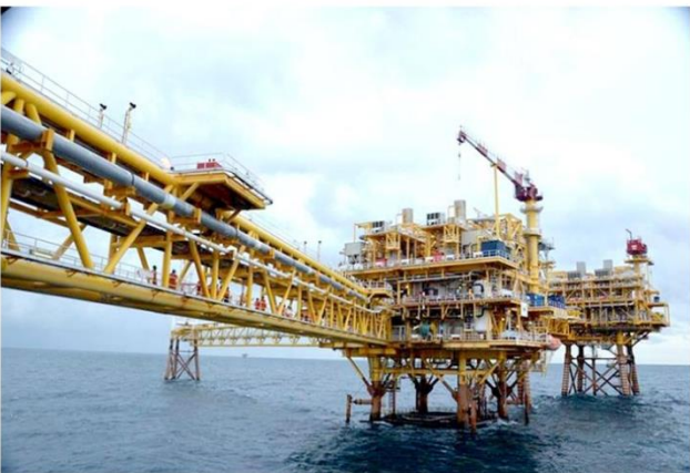
မြန်မာ့ကမ်းလှန်တွင် ရေနံနှင့်သဘာဝဓာတ်ငွေ့ ရှာဖွေတူးဖော်ဆောင်ရွက်နေမှုကို တွေ့ရစဉ် (ဓာတ်ပုံ-MOEE) https://news-eleven.com/article/223752

နှစ်ပေါင်း ၃၀ ကျော်အတွင်း မြန်မာနိုင်ငံ၏ ရေနံနှင့်သဘာဝ ဓာတ်ငွေ့ကဏ္ဍတွင် နိုင်ငံခြားရင်းနှီးမြှုပ်နှံမှုဒေါ်လာ ၂၂ ဒသမ ၇၇ ဘီလျံကျော်ရှိပြီး မြန်မာနိုင်ငံ၏ နိုင်ငံခြားရင်းနှီးမြှုပ်နှံမှုကဏ္ဍတွင် ဒုတိယမြောက် အများဆုံးကဏ္ဍဖြစ်ကြောင်း ရင်းနှီးမြှုပ်နှံမှု နှင့် ကုမ္ပဏီများညွှန်ကြားမှုဦးစီးဌာနမှ ထုတ်ပြန်ချက်များအရ သိရ သည်။