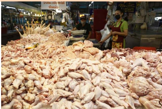
Chicken meat on sale at Simummuang wet market in Lam Luk Ka district, Pathum Thani, on Monday.