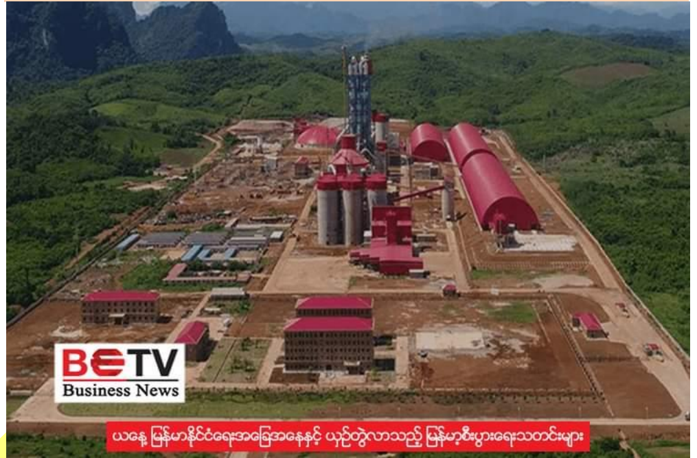
ယနေ့ မြန်မာနိုင်ငံရေးအခြေအနေနှင့် ယှဉ်တွဲလာသည့် မြန်မာ့စီးပွားရေးသတင်းများ

ရန်ကုန်မြို့တော်စည်ပင်သာယာရေးကော်မတီ(YCDC)ပိုင်ဆိုင်တဲ့ မြို့တော်ဘိလပ်မြေစက်ရုံ(ပြည်ညောင်)ကို EFD အုပ်စုက အမေရိကန်ဒေါ်လာသန်း ၇၅၀ ခန့် ရင်းနှီးမြှုပ်နှံပြီး အဆင့်မြှင့်တင်မယ်လို့ သိရပါတယ်။