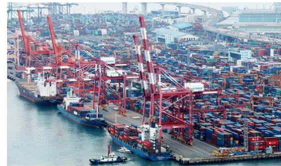
Busan Port in South Korea, Photo Courtesy: © Getty Images

တောင်ကိုရီးယားနိုင်ငံ၏ စီးပွားရေးတိုးတက်မှုနှုန်း GDP Growth သည် ၂၀၂၁ ခုနှစ်တွင် (၄) ရာခိုင်နှုန်း တိုးတက်လာခဲ့ပြီး၊ (၁၁)နှစ် တာအတွင်း စံချိန်တင်နှုန်းဖြင့်တိုးတက်ခဲ့ကြောင်း၊ တောင်ကိုရီးယား နိုင်ငံ၏ စီးပွားရေးပြန်လည်နာလန်ထူလာမှုသည် ကိုဗစ်-၁၉ ကာလ စီးပွားရေးရာအကျပ်အတည်းကြုံရချိန်တွင် G-20 အဖွဲ့ဝင်နိုင်ငံများအကြား အလျင်မြန်ဆုံးနှင့်အခိုင်မာဆုံး ပြန်လည်တိုးတက်ကောင်းမွန်လာမှုကို ပြသ နိုင်ခဲ့ကြောင်း၊ ၂၀၂၂ ခုနှစ်အတွက် GDP (၃) ရာခိုင်နှုန်း ဆက်လက် တိုးတက်ရန် ခန့်မှန်းထားကြောင်း၊ သို့ရာတွင် တစ်ချိန်တည်းတွင်ပင် ကပ်ရောဂါဆိုးအနေဖြင့် ရှည်လျားလာမည်ကိုစိုးရိမ်ကြောင်း (၂၅-၁-၂၀၂၂)