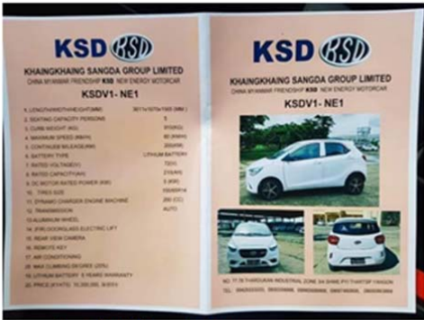
သတင်းရင်းမြစ် - ကြေးမုံ

လူ ၅ ဦး စီးနင်းနိုင်ကာ မြို့တွင်းနှင့် ခရီးဝေးနှစ်မျိုးစလုံးအတွက် ၂၀၁၉ မော်ဒယ်လ် KSD အမှတ်တံဆိပ် ဘက်ထရီစွမ်းအင်သုံး လျှပ်စစ်ကားများကို ရန်ကုန်မြို့ ရွှေပြည်သာမြို့နယ် သာဓုကန်စက်မှုဇုန်ရှိ ခိုင်ခိုင်ဆန်းဒါးအုပ်စု လီမိတက်မှ ဈေးကွက်အတွင်းသို့ စတင်ဖြန့်ဖြူးရောင်းချလိုက်ကြောင်း သိရှိရပါသည်။ လက်ရှိတွင် မော်ဒယ်နှစ်မျိုးထုတ်လုပ်ထားသည်။ KSDV1-NE1 မော်ဒယ်မှာ မြို့တွင်းသွားလာရန်ရည်ရွယ်ပြီး ခရီးဝေးသွားလာမည့်သူများအတွက် KSDV1-NE2 မော်ဒယ်ကို ရွေးချယ်ဝယ်ယူနိုင်မည်ဖြစ်သည်။