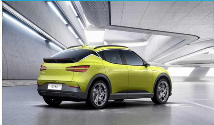
Photo: Hybrid Car

တောင်ကိုရီးယားနိုင်ငံသည် ၂၀၂၁ ခုနှစ်အတွင်း မော်တော်ယာဉ်တင်ပို့မှုတွင် အမေရိကန်ဒေါ်လာ (၄၆.၄၇) ဘီလီယံအထိတင်ပို့နိုင်ခဲ့ပြီး၊ ကိုဗစ်-၁၉ကြောင့် အပြင်း အထန်ထိခိုက်ခဲ့ရသည့် ၂၀၂၀ ပြည့်နှစ်ကထက် (၂၄.၂) ရာခိုင်နှုန်းခန့် တိုးတက်လာခဲ့ကြောင်း (၁၈-၁-၂၀၂၂) ရက်နေ့တွင် အစိုးရစာရင်း အချက်အလက်များ၏ ထုတ်ပြန်ချက်အရ သိရှိရပါသည်။ ၂၀၂၁ ခုနှစ်တွင် တောင်ကိုရီးယားနိုင်ငံ၏ စုစုပေါင်းမော်တော်ယာဉ် တင်ပို့နိုင်မှု ပို့ကုန်ပမာဏသည် (၈.၆) ရာခိုင်နှုန်းတိုးတက်ခဲ့ပြီး၊ အရေအတွက်အားဖြင့် (၂.၀၅) သန်းသို့ တိုးတက်လာခဲ့သဖြင့် (၉) နှစ်တာအတွင်း ပထမဆုံး အကြိမ်အဖြစ် ကုန်သွယ်မှုတွင် အရေအတွက်ရော တန်ဖိုးပါ နှစ်မျိုးလုံး မြှင့်တက်ခဲ့ခြင်း ဖြစ်ပါသည်။