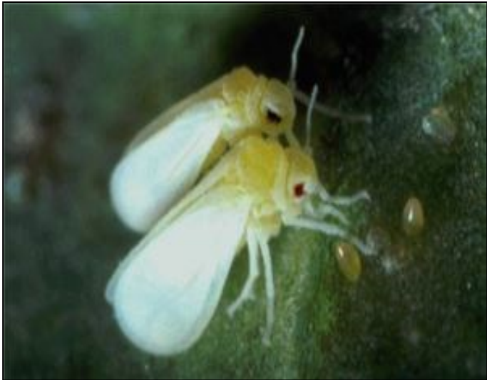
bemisia tabaci အင်းဆက်၏ပုံ

၂၀၂၁ ခုနှစ်အတွင်း အထင်ရှားဆုံးထိပ်တန်း လယ်ယာ စိုက်ပျိုးရေးသိပ္ပံတီထွင်မှု (၁၀)ခု စာရင်းကို Chinese Academy of Agricultural Sciences (CAAS) က ဇန်နဝါရီလ (၁၂) ရက်နေ့တွင် ထုတ်ဖော်ပြသခဲ့ပါသည်။ ၎င်းနည်းပညာများအနက် bemisia tabaci အင်းဆက်ပိုးမွှားကို ကာကွယ်ထိန်းချုပ်မှုအပေါ် လေ့လာမှုမှာ ထိပ်ဆုံးနေရာမှ ပါဝင်ပါသည်။ ၎င်းလေ့လာမှုတွင် ပိုးမွှားမကျစေရန် ကာကွယ်ထားမှုများအပေါ် အင်းဆက်ပိုးမွှားက မည်သို့ကျော်လွှားနိုင်သည်ဟူသည့်အပေါ် လေ့လာထားခြင်းဖြစ်ပြီး၊ bemisia tabaci ကို တိကျစွာထိန်းချုပ်နိုင်သည့် သဘာဝပတ်ဝန်းကျင်နှင့်လျော်ညီသည့် နည်းပညာဖွံ့ဖြိုးရေးအတွက် အတွေးအမြင်သစ်များကို ပံ့ပိုးကူညီပေးထားပါသည်။