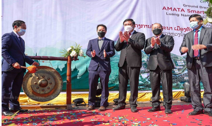
Senior officials from the government of Laos join Amata executives at the signing ceremony to develop Amata Smart and Eco City in Natuey, Laos.