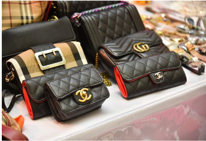
Counterfeit products that violate intellectual property law.

စီးပွားရေးနှင့်ကူးသန်းရောင်းဝယ်ရေးဝန်ကြီးဌာန