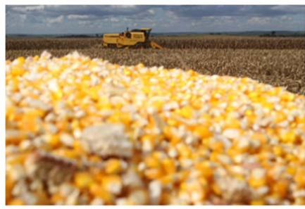
Corn.