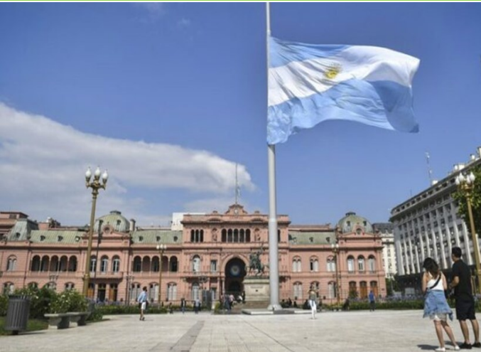
Argentina.

အာဂျင်တီးနားနိုင်ငံ သမ္မတ Alberto Fernández သည် ပြည်တွင်းကုန်ဈေးနှုန်းကြီးမြင့်မှုနှင့် ငွေကြေးဖောင်းပွမှုကိုထိန်းချုပ်ရန်အတွက် ပဲပုတ်ဆီနှင့် ပဲပုတ်စေ့ထွက်ကုန်ပစ္စည်းတင်ပို့မှုများအပေါ် ပို့ကုန်အခွန် ၃၁ ရာခိုင်နှုန်းကောက်ခံခဲ့ရာမှ နှုန်းထားအသစ်ဖြစ်သည့် ၃၃ ရာခိုင်နှုန်းသို့ တိုးမြှင့်