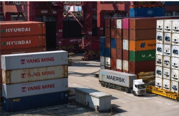
China is clinging to a zero-tolerance approach to containing the pandemic, causing congestion at major ports in southern China.

ဟောင်ကောင်ဒေသနှင့် ရှန်းကျန်မြို့တို့၌ ကမ္ဘာ့ကပ်ရောဂါ ကိုဗစ်-၁၉ ဖြစ်ပွားမှု မြင့်တက်လျက်ရှိသောကြောင့် ကိုဗစ်-၁၉ ဖြစ်ပွားမှု ထိန်းချုပ်ရန် ဒေသအာဏာပိုင်များ၏ ကန့်သတ်ချက်များကြောင့် နွေရာသီကာလအလွန် အမေရိကန်သို့ ကုန်ပစ္စည်းများတင်ပို့မည့်အပေါ် အခက်အခဲများဖြစ်ပွားလျက်ရှိကြောင်း၊ ယခုရက်သတ္တပတ်အတွင်း ဟောင်ကောင်ဒေသနှင့် ရှန်းကျန်မြို့တို့ရှိ ဆိပ်ကမ်းများ၌ ကုန်သေတ္တာများ ပြည့်ကျပ် ပိတ်ဆို့မှု အမြင့်ဆုံး ဖြစ်ပွားလျက်ရှိကြောင်း ၂၀၂၂ ခုနှစ်၊ မတ်လ ၂၆ ရက်နေ့ထုတ် South China Morning Post သတင်းစာ၌ “Jammed ports threaten more supply chain chaos” ခေါင်းစဉ်ဖြင့် ရေးသားဖော်ပြထားပါသည်။ အဆိုပါ သတင်းဆောင်းပါးတွင် လွန်ခဲ့သော(၂) နှစ်ကျော်က စတင်၍ ကိုဗစ်-၁၉ ရောဂါဗိုင်းရပ်စ်ကြောင့် ကမ္ဘာ့ကုန်သွယ်