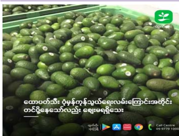
ထောပတ်သီး ပုံမှန်ကုန်သွယ်ရေးလမ်းကြောင်းအတိုင်း တင်ပို့နေသော်လည်း ဈေးမရရှိသေး

နှစ်လကျော်ကြာ ရပ်တန့်ခဲ့သည့် ထောပတ်သီး ပြည်ပတင်ပို့မှု ပြန်လည်တင်ပို့ နိုင်ပြီဖြစ်ကြောင်း မြန်မာနိုင်ငံ ထောပတ်သီး တင်ပို့ရောင်းချသူများအသင်းမှ သိရသည်။