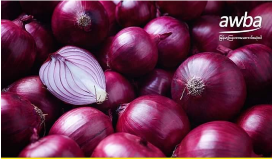
ကြက်သွန်နီအသစ်များ ဝင်ရောက်လာသော်လည်း ဈေးကွက်တည်ငြိမ်နေ

ကြက်သွန်နီသစ်များ ဈေးကွက်သို့ ဝင်ရောက်ချိန်တွင် ဈေးနှုန်း ကျဆင်းလေ့ရှိသော်လည်း ယခုနှစ်တွင် ပြည်ပတင်ပို့မှုရှိနေသဖြင့် ဈေးကျဆင်းမှုမရှိပဲ ပုံမှန် အရောင်းအဝယ်ကောင်းလျက်ရှိကြောင်း သိရသည်။