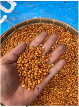
မကွေးဂျာနယ်

ပြည်တွင်းရှိပဲများ လက်ကျန်နည်းလောတာကြောင့် အိန္ဒိယကုန်သည်များ ဝယ်လိုအား မြင့်တက်လာကြောင်း ပဲနှမ်းကုန်သည်များထံက သိရသည်။