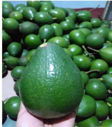
Popular News Journal

ပြည်ပဈေးကွက် တစ်ခုဖြစ်သည့် ထိုင်းနိုင်ငံသို့ မြန်မာ့ထောပတ်သီးများကို နယ်စပ်ကုန်သွယ်မှုမှတစ်ဆင့် တင်ပို့လျက်ရှိရာ လက်ရှိတွင် တန်ချိန် (၁၀၀၀) ကျော် တင်ပို့ထားနိုင်ကြောင်း မြန်မာနိုင်ငံ ထောပတ်သီးစိုက်ပျိုးထုတ်လုပ် တင်ပို့ရောင်းချသူများအသင်းမှ သိရသည်။