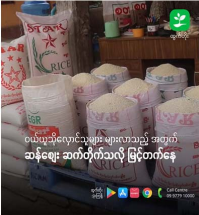
ဝယ်ယူသိုလှောင်သူများ များလာသည့် အတွက် ဆန်ဈေး ဆက်တိုက်သလို မြင့်တက်နေ

ဈေးတင်ရောင်းချရန်အတွက် အချို့ဆန်ကုန်သည်များမှ ဝယ်ယူသိုလှောင်သူများ ရှိနေသောကြောင့်ဆန်ဈေး အမြင့်ဈေးတွင် ဆက်ရှိနေကြောင်း ဆန်ဈေးကွက်ကနေ သိရသည်။