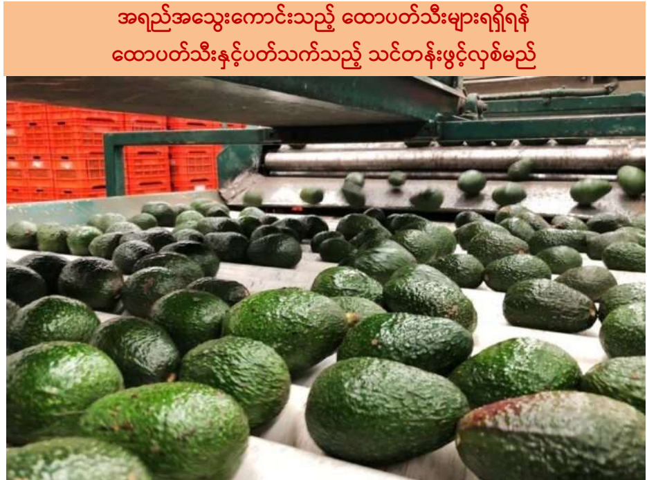
အရည်အသွေးကောင်းသည့် ထောပတ်သီးများရရှိရန် ထောပတ်သီးနှင့်ပတ်သက်သည့် သင်တန်းဖွင့်လှစ်မည်

အရည်အသွေးကောင်းသည့်ထောပတ်သီးများရရှိရန် မြန်မာနိုင်ငံထောပတ်သီးအသင်းမှ ထောပတ်သီးစိုက်တောင်သူများအတွက် လာမည့်နှစ်တွင် ထောပတ်သီးနှင့်ပတ်သက်သည့် သင်တန်းဖွင့်လှစ်သွားမည်ဖြစ်ကြောင်း သိရသည်။