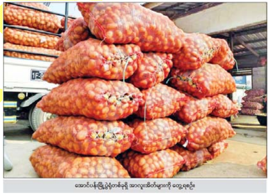
အောင်ပန်းမြို့ပွဲတစ်ခုရှိ အာလူးအိတ်များကို တွေ့ရစဉ်။

အာလူးအဝင်များလာသည့်အတွက် ဈေးကျနေပြီး လာမည့် လပိုင်းတွင်လည်း ယခုအတိုင်း ဆက်လက်ရှိနေနိုင်ကြောင်း အာလူး ဈေးကွက်အတွင်းမှသိရသည်။ ယင်းသို့ အာလူးဈေးနှုန်းများ ဆက်လက်ကျဆင်းနေခြင်းမှာ မြန်မာနိုင်ငံဈေးကွက်အတွင်းသို့ တရုတ်နိုင်ငံဘက်မှ မျက်နှိအာလူးများ ဝင်ရောက်လာခြင်းအပါအဝင် မြန်မာနိုင်ငံအတွင်း စိုက်ပျိုးထွက်ရှိသည့် အာလူးများ ဈေးကွက်အတွင်း ပေါများလာသောကြောင့်ဖြစ်ကြောင်းသိရသည်။ “စပေါ်တုန်းကဆို ဆိုဒ်ကြီးက တစ်ပိဿာ ငွေကျပ် ၂,၆၀၀ ကနေ ငွေကျပ် ၂,၈၀၀ အထိ ရောင်းတာ။ အခုအဲဒီဆိုဒ်က ငွေကျပ် ၂,၀၀၀ ပဲတန်တယ်။ ကျသွား တာပေါ့။ နှစ်ပတ်ကျော်လောက်တော့ရှိပြီ။ ဘာလို့ကျတာလဲဆိုတော့ မန္တလေးဘက်လည်း အာလူးတွေရပြီလေ။ မြစ်ကြီးနား ဘက်ကရပြီ။ နောက်ပြီး တရုတ်ပြည်ဘက်ကနေ ဈေးချိုတဲ့မျက်နှိအာလူးတွေ ဝင်လာပြီ။ နောက်လအထိ သွားမယ်ထင်တယ်” ဟု ဟိုပုံးမြို့နယ်ရှိ အာလူးရောင်းဝယ်ရေးဆိုင်တစ်ဆိုင်မှ ဆိုင်ရှင်တစ်ဦးကပြောသည်။