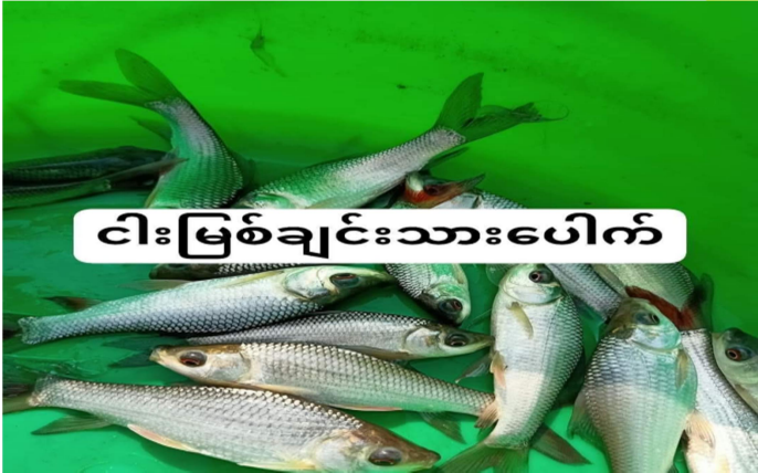
ငါးမြစ်ချင်းသားပေါက်

ဧရာဝတီတိုင်းဒေသကြီး၊ မအူပင်ခရိုင်သည်စပါးကို အဓိကစိုက်ပျိုးပြီး ရေထွက်ကုန်၊ လယ်ယာထွက်ကုန်များ လုပ်ငန်းများ လုပ်ကိုင်ဆောင်ရွက်နိုင်ရန် မြေခံ ၊ ရေခံ ကောင်းမွန်သော မြို့နယ်တစ်ခုဖြစ်သည်။