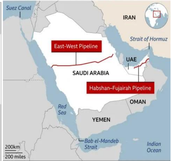
Key pipelines that bypass Strait of Hormuz